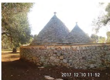
Ceglie Messapica 'Il trullo di selce' Rarità mondiale da sottoporre a tutela

CLIENTE: DISTRETTO PRODUTTIVO DELL'INFORMATICA