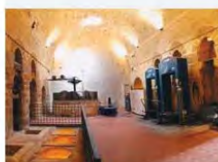
Lizzanello (Le), Frantorio ipogeo dei Celestini