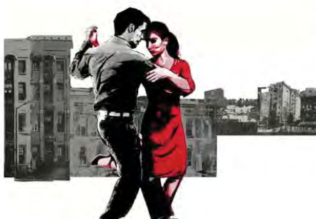
'La Genovese' di Enrico Fierro tra cucina e politica in salsa 'arraggiata'