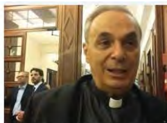
Sparatoria a Bitonto, la condanna di Mons. D'Urso