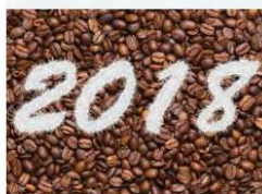
Auguri! Il 2018 sia intenso, stimolante e appagante